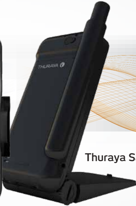
Thuraya SatSleeve Hotspot