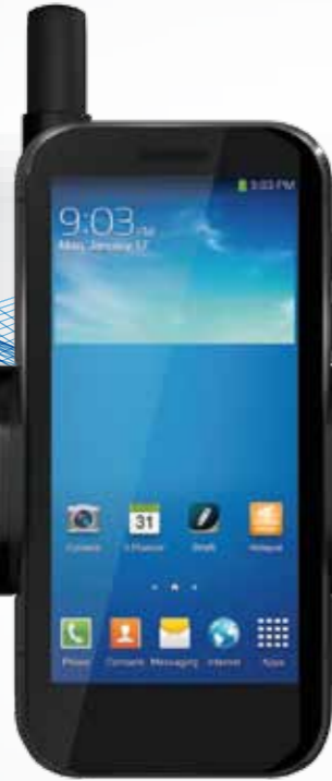
Thuraya SatSleeve plus